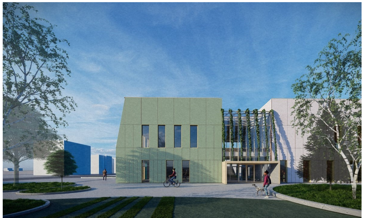
Projekt Centrum Usług Publicznych przy ul. Bydgoskiej 10 w Łubiance

Priorytetem naszej Gminy jest także poprawa bezpieczeństwa komunikacyjnego. W październiku 2022 roku Wójt Gminy zawarł 3 umowy z wykonawcami na przebudowę dróg gminnych. W