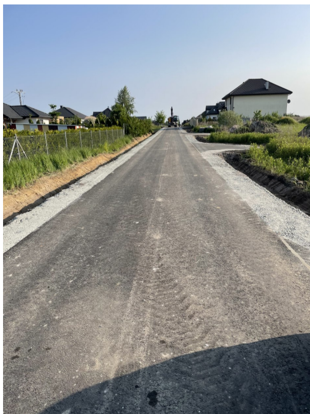
Zmodernizowane ulice Parkowa i Chmielna w Pigży